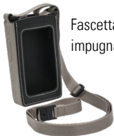
Fascetta per impugnare la radio