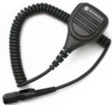
Microfono con altoparlante remote (RSM)